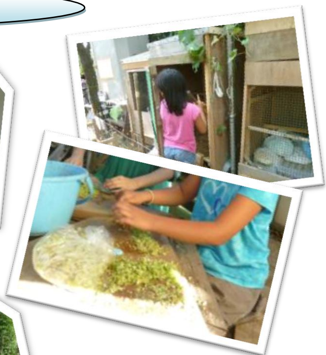
9月8日(土)鳥小屋の清掃とウコッケイのエサ作り