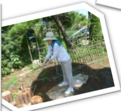
9月24日(月)妊婦さん薪割り体験