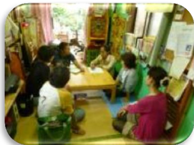
9月10日(月)ボランティア打合せ 9月28日(金)校長先生による ソーシャルスキル指導