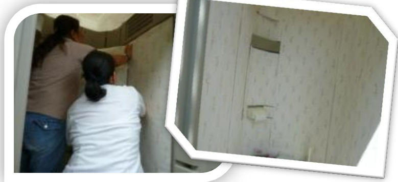
9月5日(水)トイレの壁紙貼り